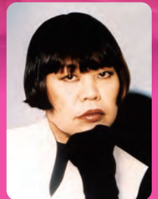
コシノ・ジュンコ (デザイナー)